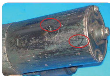
Nečitelné číslo, chybějící štítek