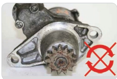
S hřídelí nelze otáčet